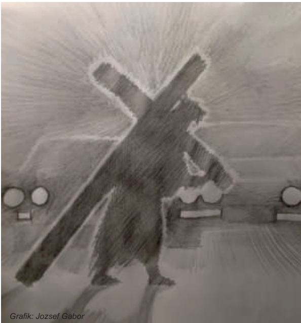
Grafik: Jozsef Gabor

Kreuzesnachfolge kennt keinen Kalender und braucht keine Karte.